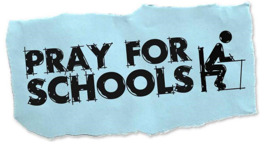
Caru Ein Hysgolion #loveourschools